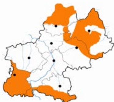
Carte localisant l'utilisation des charpentes à chevrons formant ferme en Midi-Pyrénées