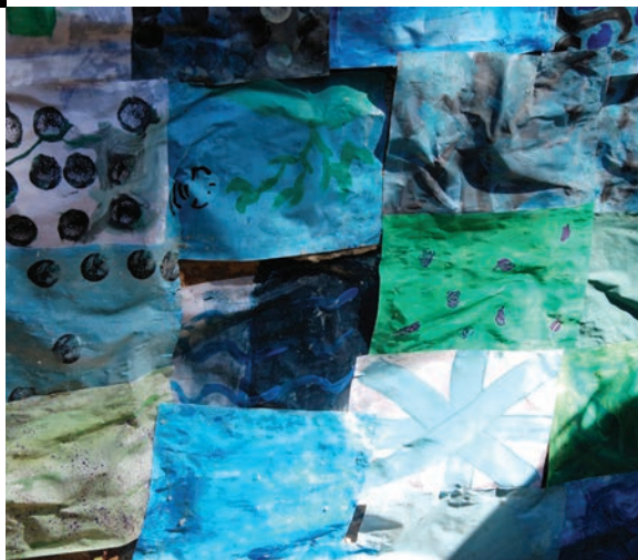
le mur d'eau du lavoir /