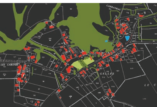
les trames du village /