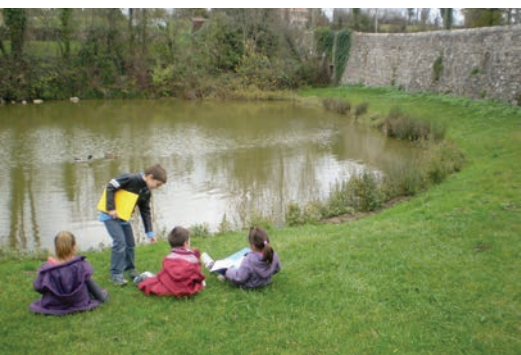
séance de croquis au bord de la mare /