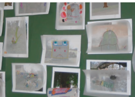
détails du village détournés /