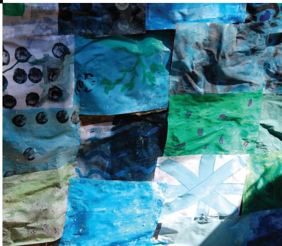
le mur d'eau du lavoir /