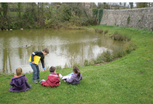
séance de croquis au bord de la mare /