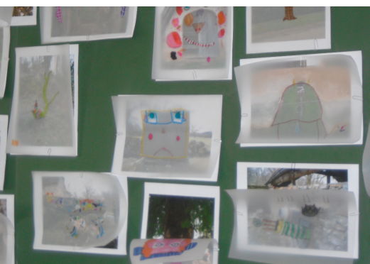
détails du village détournés /