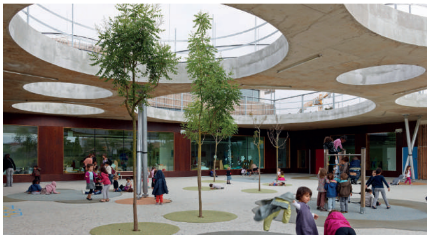
Gruppe scolaire Lucie Aubrac, Toulouste, 2012. Laurens & Loustau arch.

L'appel d'offres, qui est la procédure traditionnelle d'achat des fournitures, n'est donc pas approprié aux marchés de prestations intellectuelles. C'est d'ailleurs pour cette raison qu'il est proscrit en procédure formalisée dès qu'il y a conception architecturale.