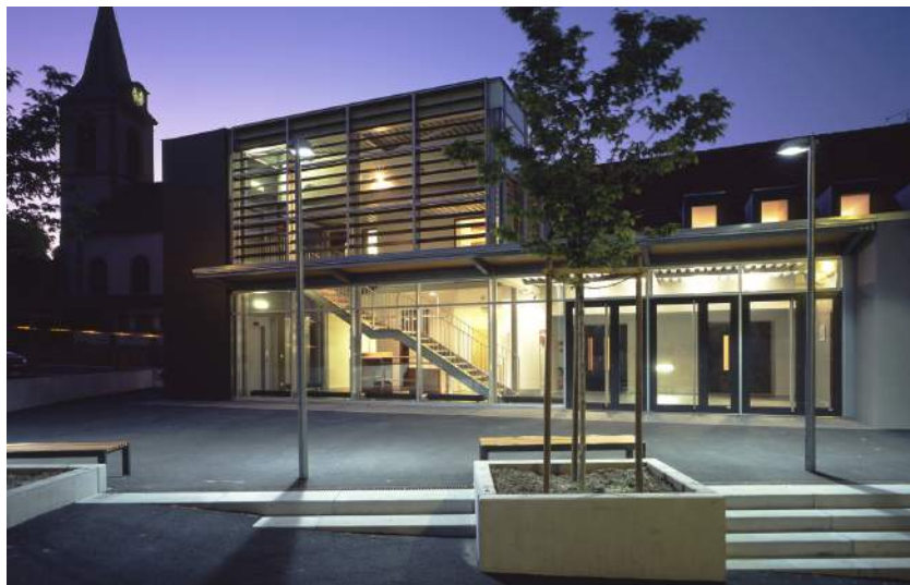
Extension et reconstruction de la salle des fêtes, Beblenheim, Auger-Rambeaud architectes, 2006 © Christophe Bourgeois

Ce guide dispose désormais d'une version numérisée, dénommée « Simulateur d'honoraires », accessible sur le site de la MIQCP ( www.miqcp.gouv.fr ). Il s'agit d'un outil d'évaluation prévisionnelle des honoraires pour des opérations de construction neuve de bâtiments.