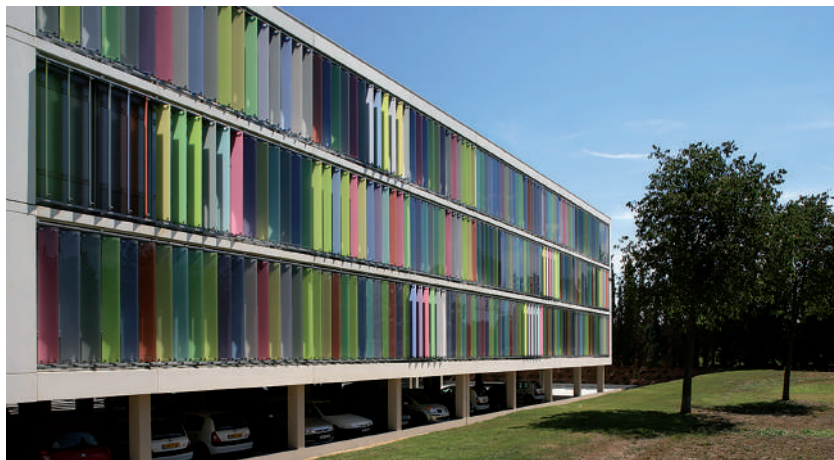
Hôtel communautaire du Grand Avignon (84), 2007, Jacques Fradin & Jean-Michel Weck arch. associés

N.B. : Aucune disposition du code des marchés publics ne prévoit ni la pondération, ni la hiérarchisation des critères de sélection des candidatures.