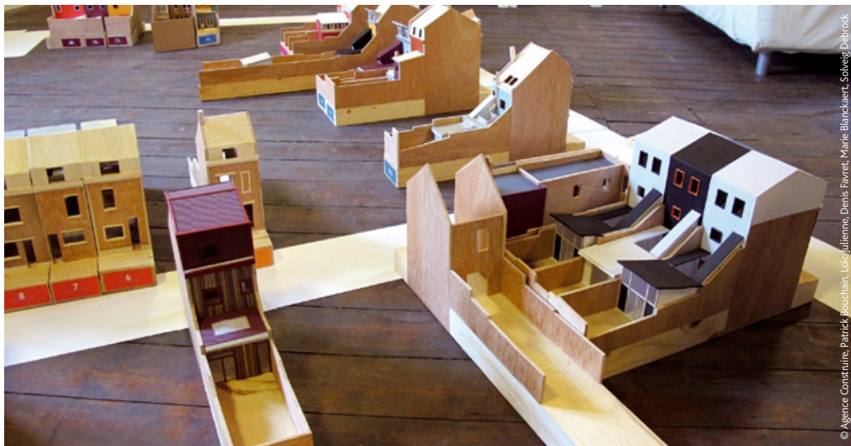
© Agence Construire, Patrick Bouchain, Loïc Julienne, Denis Favret, Marie Blanckaert, Solveig Debrock

L'Union est un projet de renouvellement urbain de la métropole lilloise, qui couvre une zone de 80 hectares à cheval sur Roubaix, Wattrelos et Tourcoing, dans le Nord (59). Au nord du site, les habitants de l'îlot Stephenson, regroupés en association, se sont opposés à sa démolition. Cette mobilisation a incité l'aménageur à entreprendre une démarche innovante de « coproduction de logements ». Ce projet concerne 30 des 54 maisons de l'îlot (24 sont occupées ou mises en location par leur propriétaire) et doit faciliter l'acquisition d'un logement à coût réduit grâce à la mise en place d'un dispositif d'autoréhabilitation avec les futurs occupants.