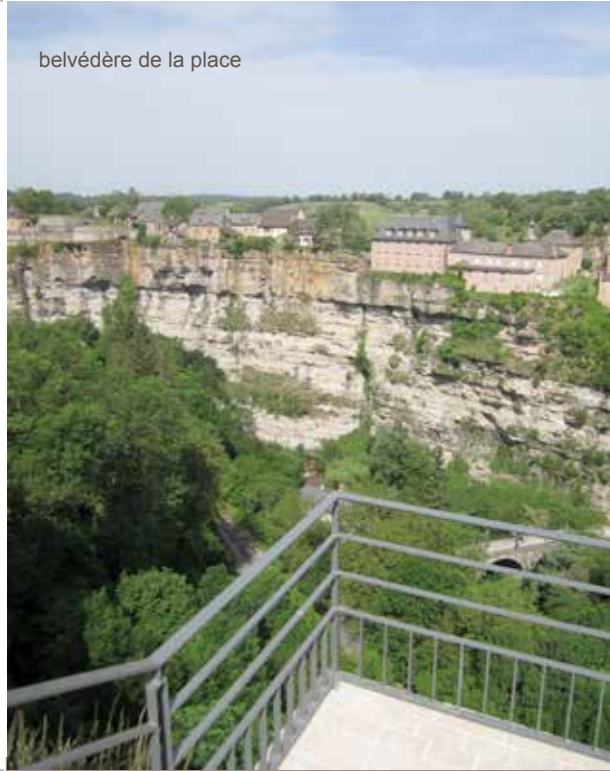
belvédère de la place

En effet, tout ne peut pas être rendu accessible, de façon normative. Il s'agit d'améliorer par une démarche sincère et une conception réfléchie et aboutie, le confort de tout un chacun.