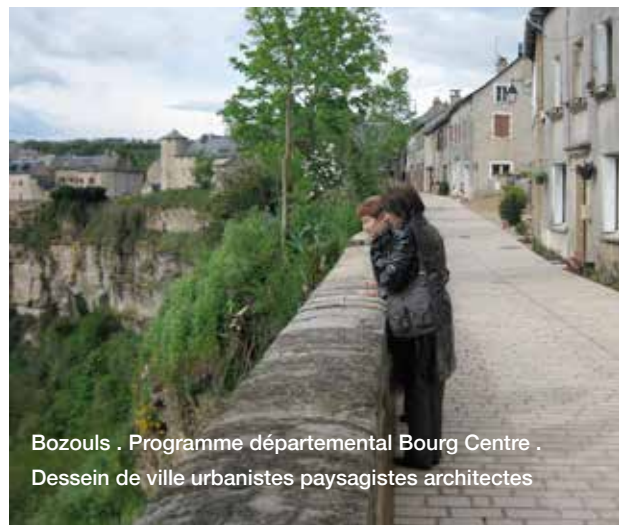
Bozouls . Programme départemental Bourg Centre . Dessain de ville urbanistes paysagistes architectes

Le diagnostic préalable du CAUE avait mis en évidence le caractère de belvédère de la place en vue plongeante sur le site.