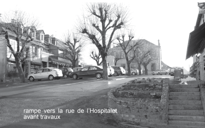
rampe vers la rue de l'Hospitalet avant travaux