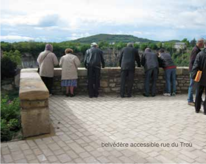
belvédère accessible rue du Trou