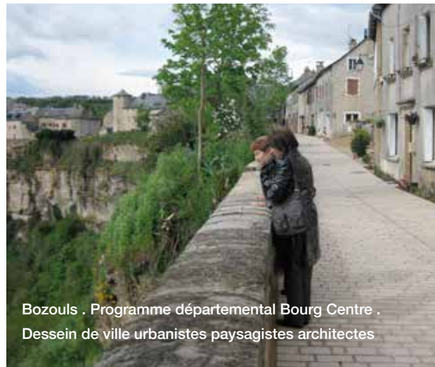
Bozouls . Programme départemental Bourg Centre . Dessain de ville urbanistes paysagistes architectes

Le diagnostic préalable du CAUE avait mis en évidence le caractère de belvédère de la place en vue plongeante sur le site.