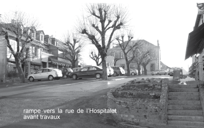
rampe vers la rue de l'Hospitalet avant travaux