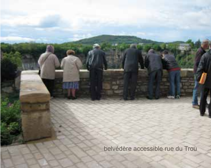
belvédère accessible rue du Trou