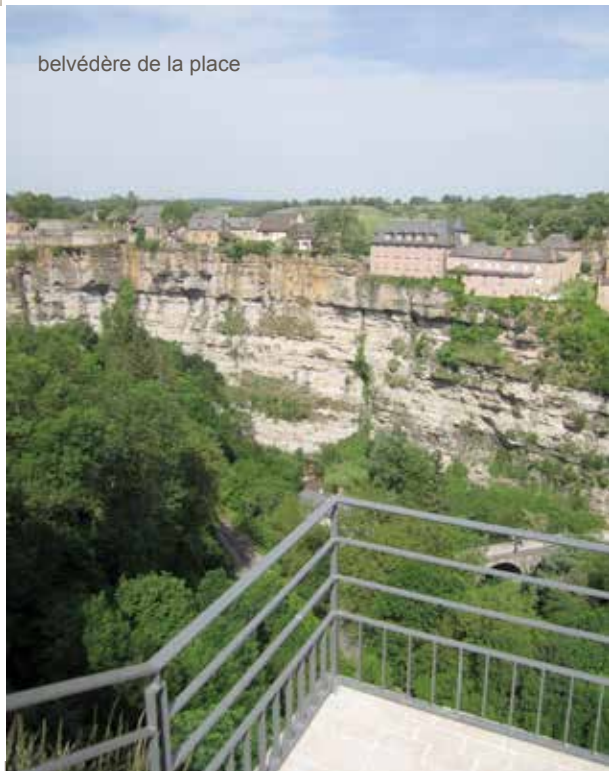
belvédère de la place

En effet, tout ne peut pas être rendu accessible, de façon normative. Il s'agit d'améliorer par une démarche sincère et une conception réfléchie et aboutie, le confort de tout un chacun.