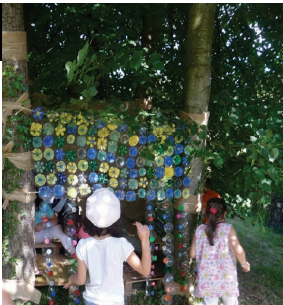
montage des murs /