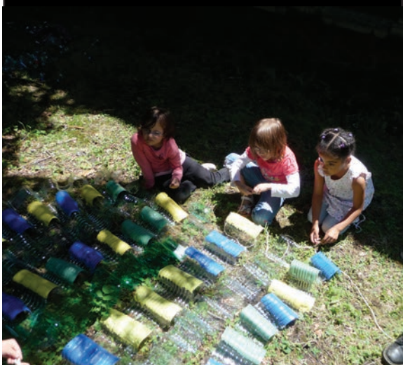
Un porche d'entrée coloré se fond dans les branches basses des grands arbres /