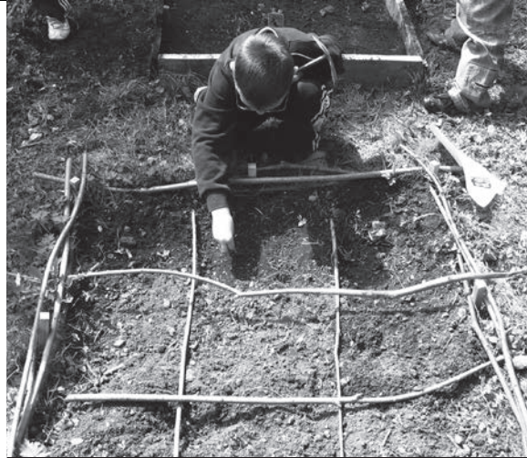
semis attentionnés ...