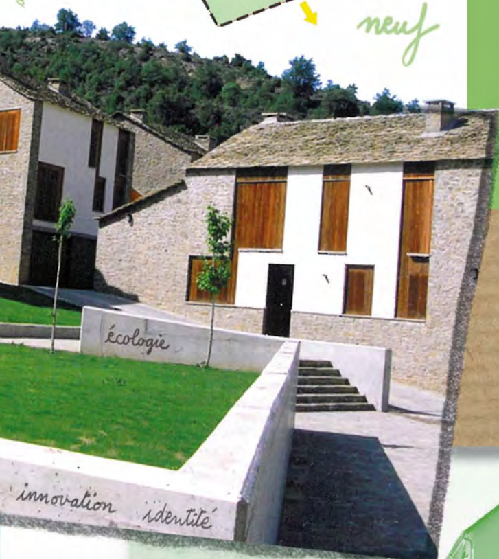
Huesca, Espagne - Labarta Gracia & Alfaro.