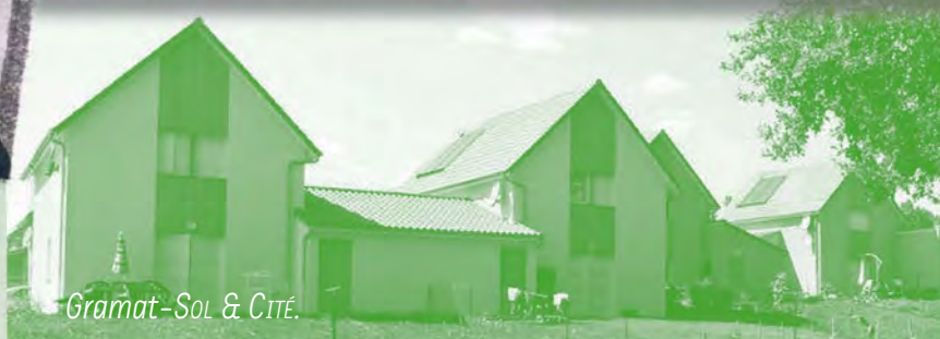
Gramat-SOL & CITÉ.